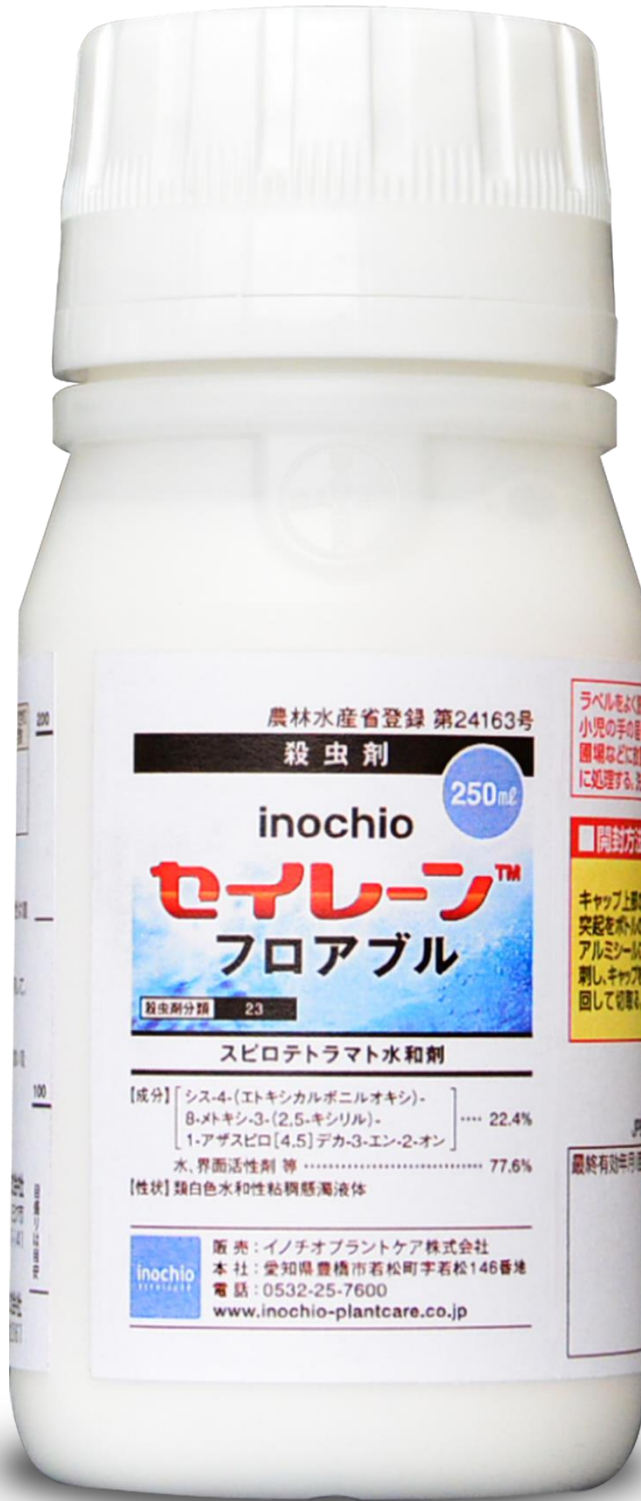
inochio セイレーンフロアブル ( 250ml 容器)