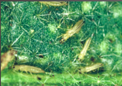
ミカンキイロアザミウマ