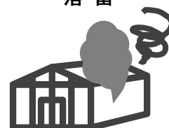
農業用付帯設備の故障