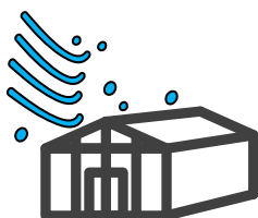
風災・ひょう災・雪災