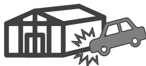
不足かつ突発的な事故