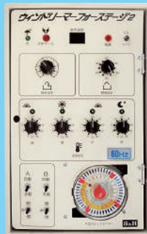
ウィンドリーマーフォーステージ2