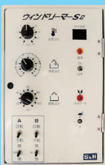
ウィンドリーマーS2